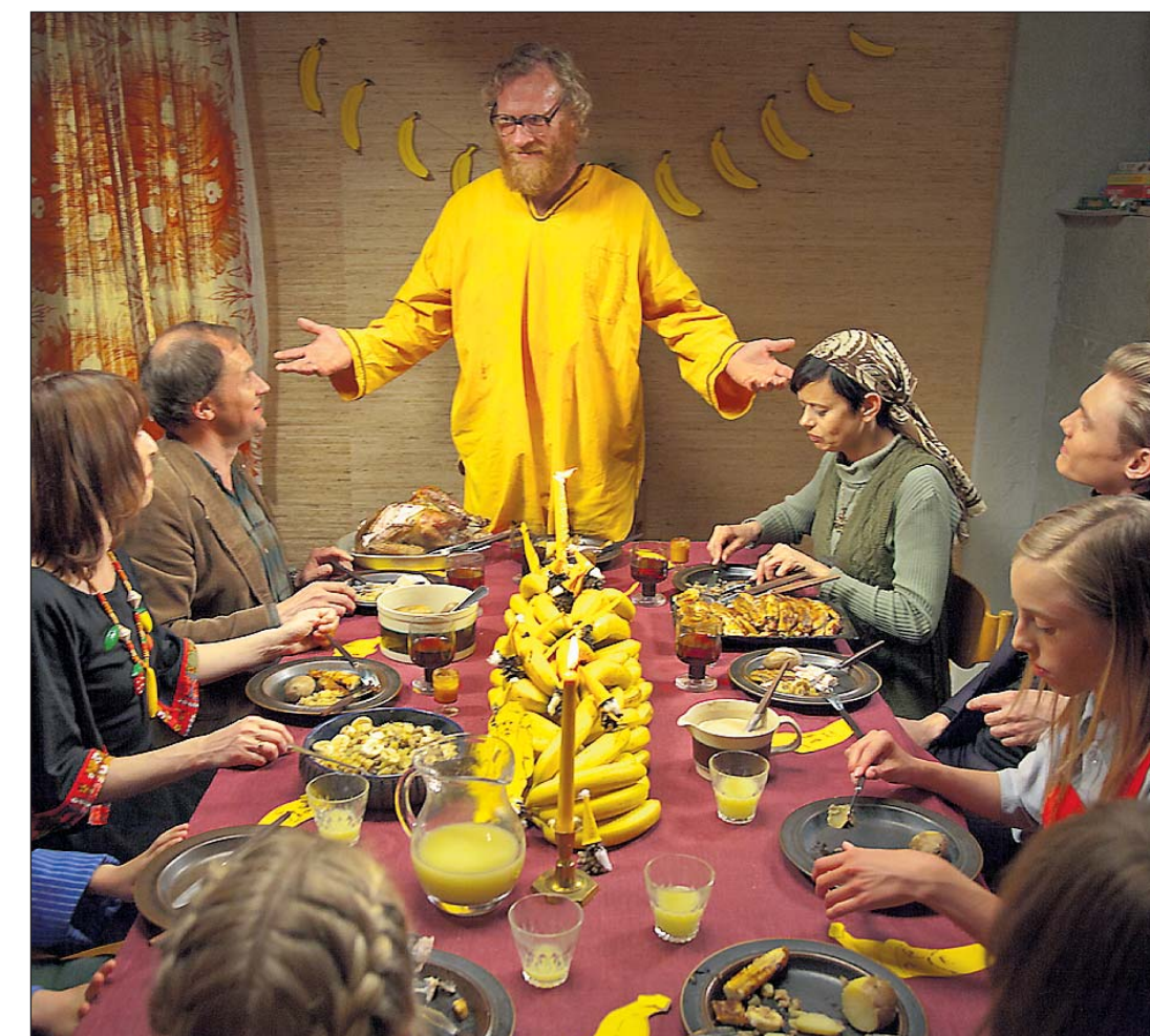
Alternativ jul. Julefeiringen med bananer er en av filmens festligste scener.