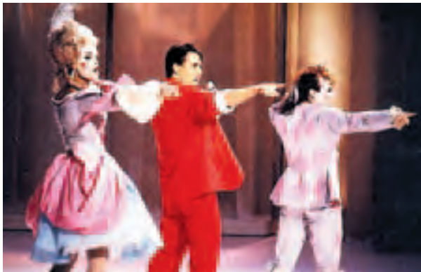
GREAT GARLIC GIRLS: Alle syntes det var en dårlig idé Nettopp derfor ville han ha med Great Garlic Girls i Grand Prix.