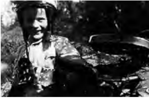
MOTORSYKKEL: Artisten som ung harstadværing. Snart skulle han bygge sin første gitar av papp og planer.

HAN SKULLE BLITT Norges Bob Geldof. Ideen om en norsk artistduognad kom rekende i en sen kveldstime. I løpet av natta skrev