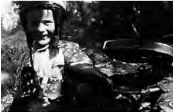
MOTORSYKKEL: Artisten som ung harstadværing. Snart skulle han bygge sin første gitar av papp og planer.

HAN SKULLE BLITT Norges Bob Geldof. Ideen om en norsk artistduognad kom rekende i en sen kveldstime. I løpet av natta skrev