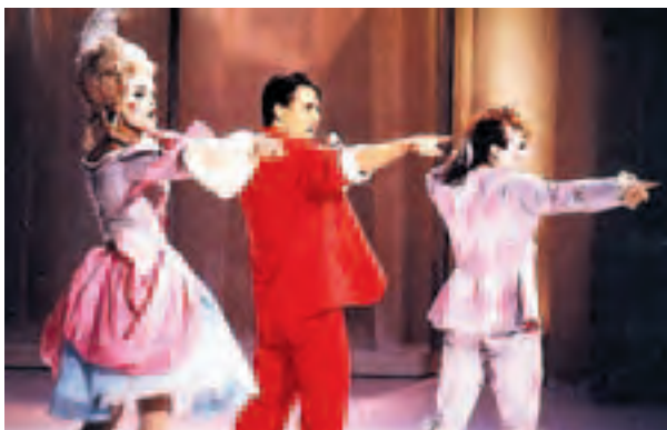
GREAT GARLIC GIRLS: Alle syntes det var en dårlig idé Nettopp derfor ville han ha med Great Garlic Girls i Grand Prix.