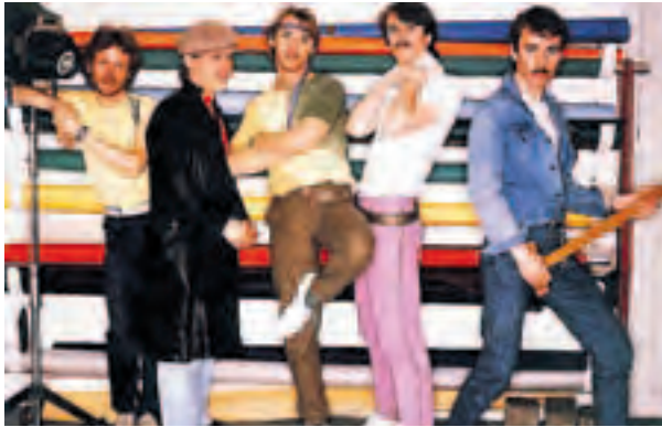
ZOO: De var blant landets største popstjerner og har solgt 200.000 plater.